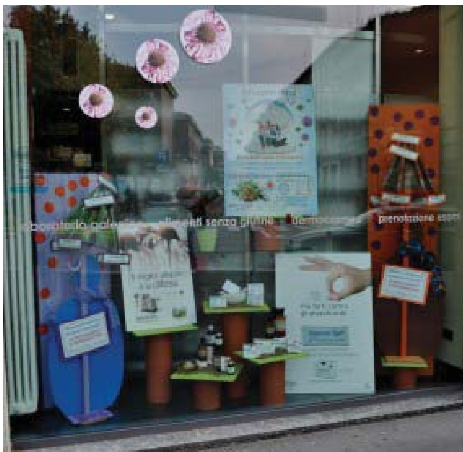
Farmacia S. Maria alla Fontana – Milano

Mi raccomando, prestate sempre particolare attenzione alla presentazione dei prodotti, in questo secondo caso rigorosamente naturali.