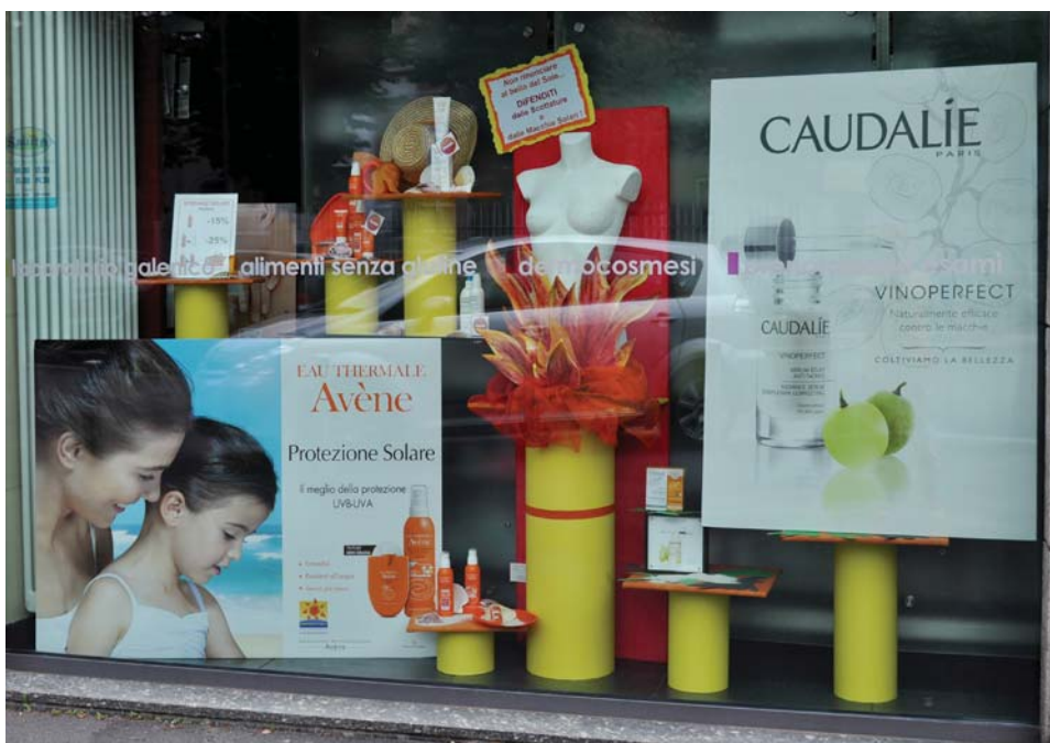
Farmacia Santa Maria alla Fontana – Milano

La farmacia Santa Maria alla fontana di Milano, è stata audace nell'unire solari e creme anti-macchia per il viso. Il rogo di sera prende vita grazie a miniluci led che lo animano nell'oscurità.