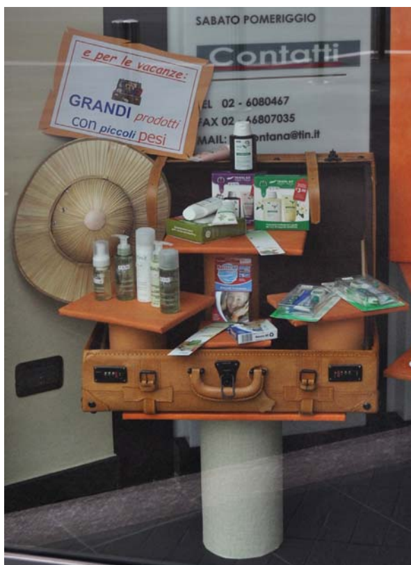
Farmacia Santa Maria alla Fontana – Milano

Cosa meglio di una valigia può far da contorno ai prodotti di piccola taglia da portarsi in vacanza?