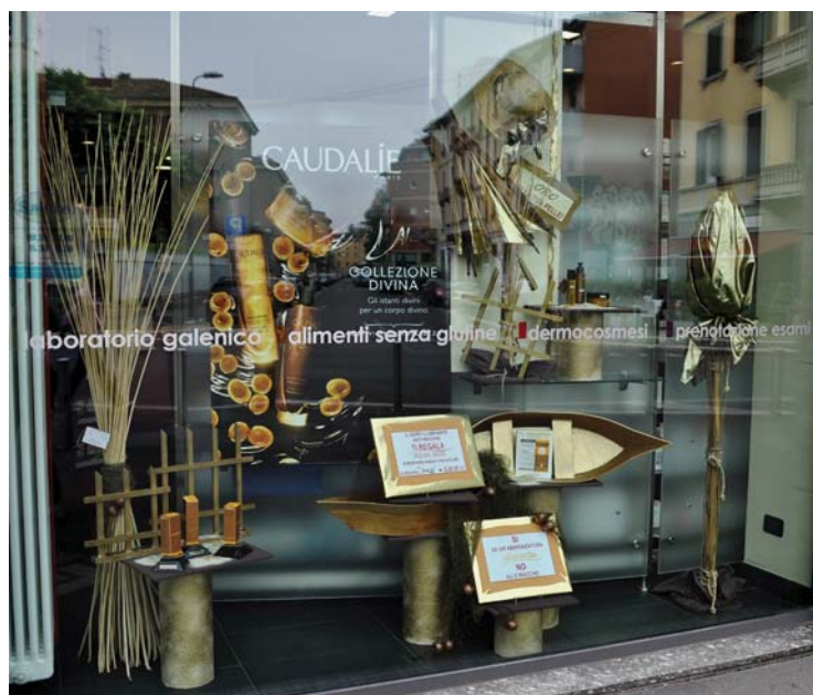
Farmacia Santa Maria alla Fontana – Milano

Cosa meglio di una valigia può far da contorno ai prodotti di piccola taglia da portarsi in vacanza?