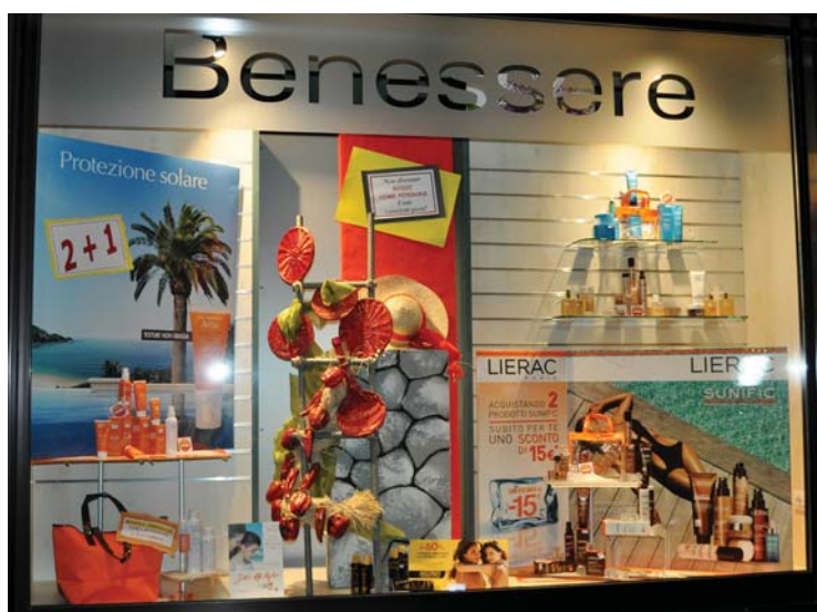
Farmacia San Lorenzo - Parabiago (Mi)

La vetrina di luglio della farmacia San Lorenzo invita a usare i prodotti giusti per non diventare rossi... come peperoni!