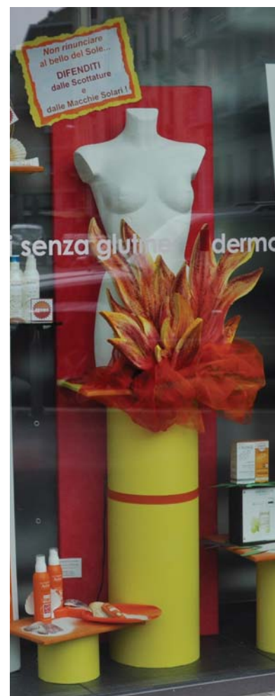
Farmacia Santa Maria alla Fontana – Milano