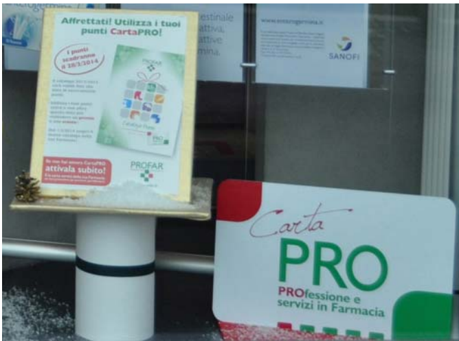
Altri modi per riproporre il tema