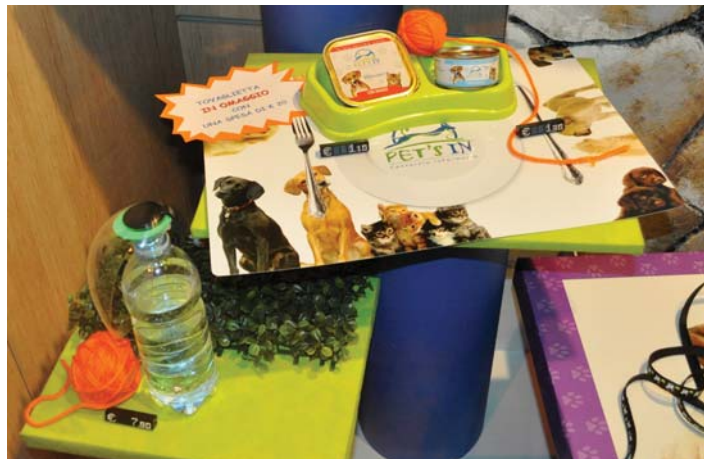
I dettagli curati