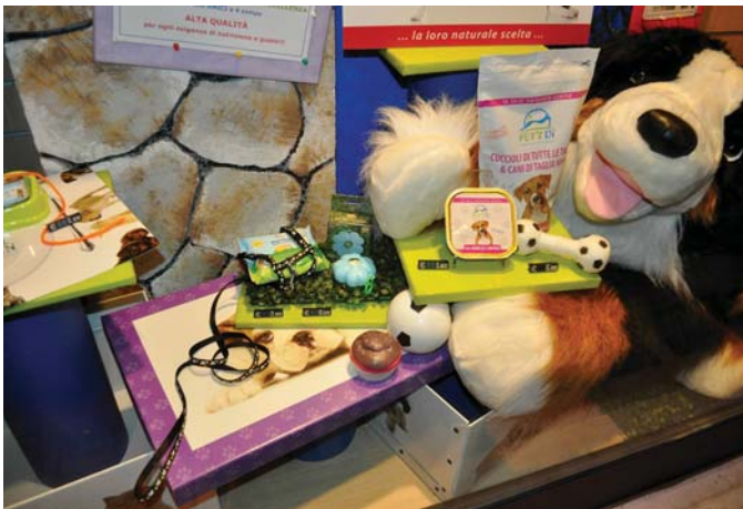
Tanta attenzione ai particolari