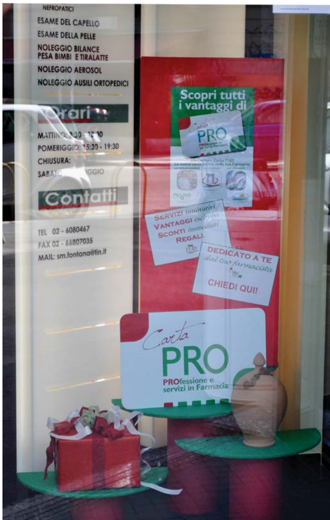
La prima volta, quale novità

Avete una carta fedeltà e dovete ricordarlo al pubblico? Lo avete già fatto altre volte, come dunque parlarne nuovamente, ma in modo diverso? Come ha fatto la farmacia Santa Maria alla fontana di Milano :