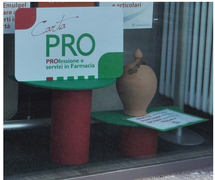
La seconda volta