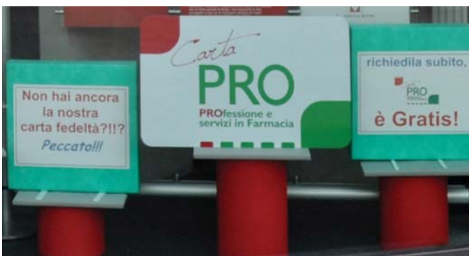
E ancora un'altra vetrina